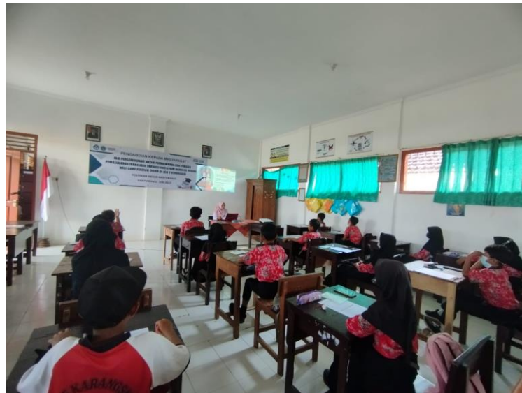
Gambar 5. Pengaplikasian Penggunaan Media Yang Sudah Dibuat