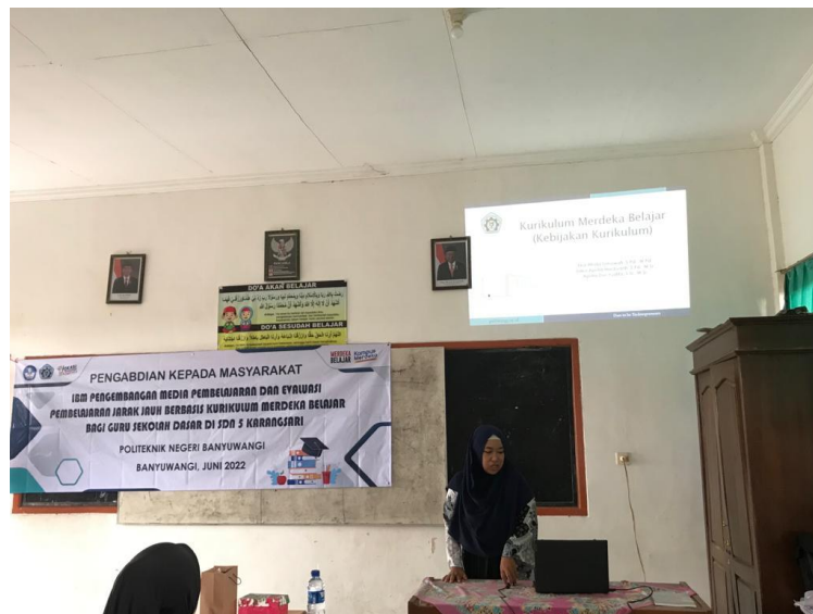
Gambar 3. Pelaksanaan Workshop Merdeka Belajar