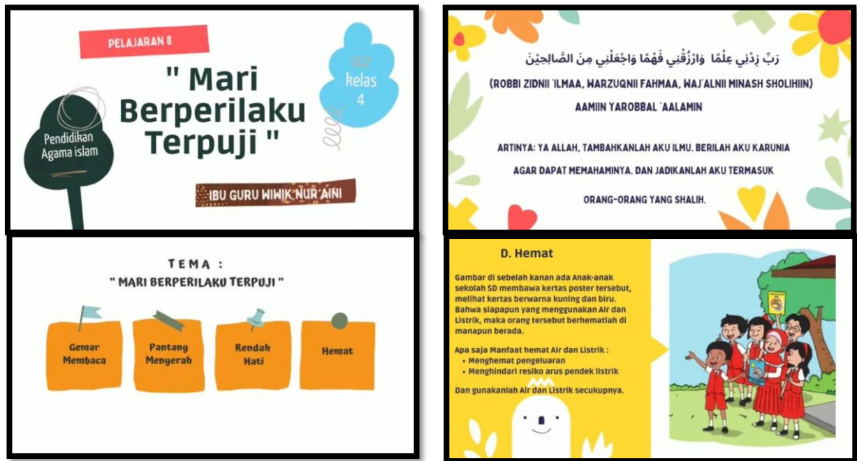
Gambar 4. Hasil Media Pembelajaran dari Salah Satu Guru Agama