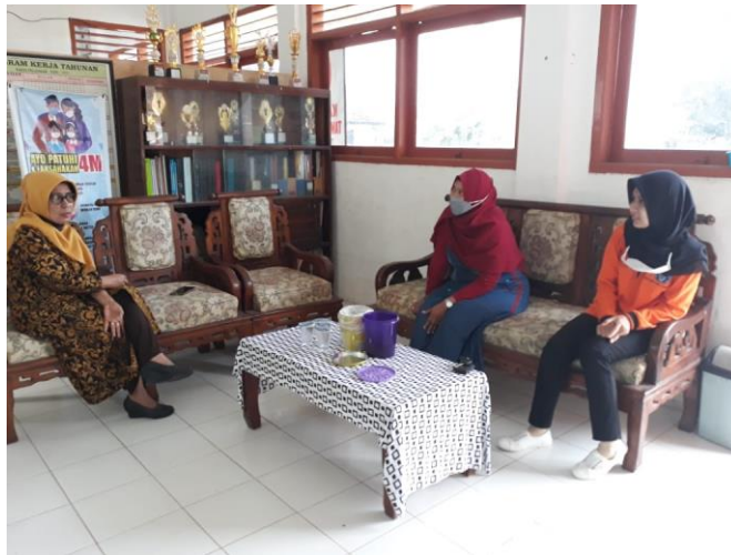
Gambar 2. Kegiatan Koordinasi dengan Pihak SDN 5 Karangsari

Pelaksanaan kegiatan pengabdian ini berjalan lancar dan para guru serta murid sangat antusias dengan pelaksanaan workshop tersebut. Output dari workshop ini adalah guru-guru diminta untuk membuat media pembelajaran untuk mata pelajaran yang mereka ampu.